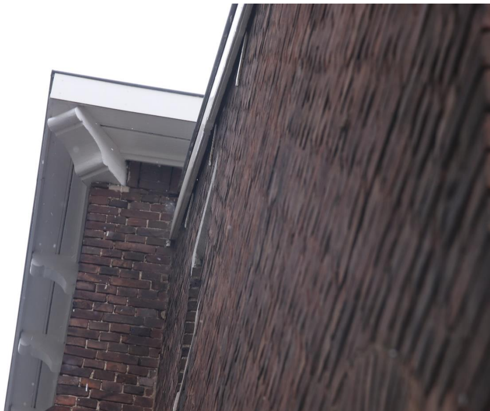
Foto 1: De daken zijn ongeschikt voor gierzwaluwen, huiszwaluwen en huismussen om te broeden.

In de directe omgeving van het gebouw kunnen in zéér beperkte mate broedvogels aanwezig zijn. Hierbij valt te denken aan Turkse tortel, houtduif, merel en roodborst.