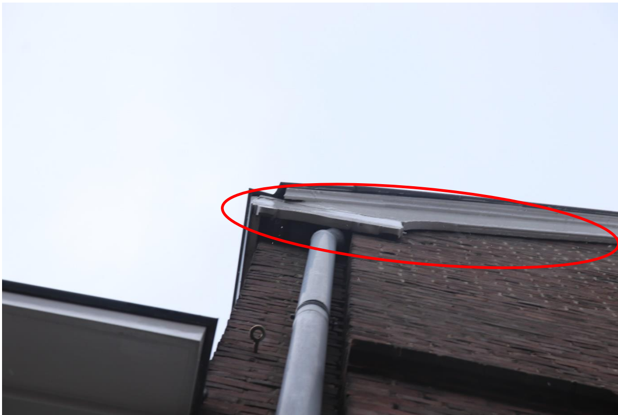
Foto 2: Op meerdere plekken zijn openingen aanwezig die het voor vleermuizen mogelijk maakt het pand als verblijfplaats te gebruiken

Primaire vliegrouetes en essentieel foerageergebied zijn op voorhand uit te sluiten omdat er op het terrein rondom het gebouw nagenoeg geen bomen en/of struiken aanwezig zijn die als essentieel leefgebied dienst kunnen doen. Er kan door enkele dieren gejaagd kunnen worden in het gebied.